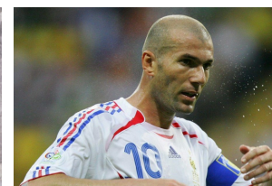
Zinedine Zidane, Footballeur