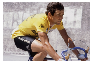
Bernard Hinault, Cycliste