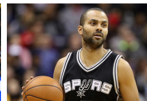
Tony Parker, Basketteur